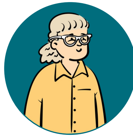
Helena 83 v.