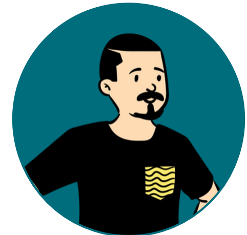
Jani 28 v.