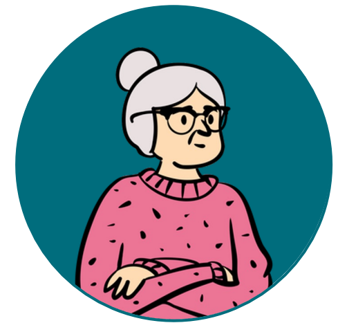
Aune 91 v.