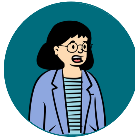
Suvi 54 v.