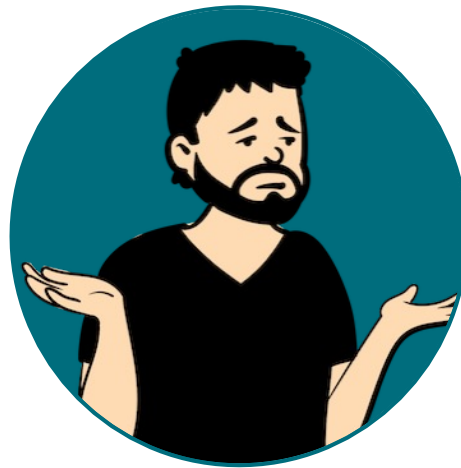
Otso 40 v.