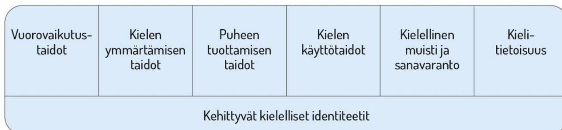
Kuvio 2. Lasten kielen kehityksen keskeiset osa-alueet varhaiskasvatuksessa

Kielen oppimisen kannalta on tärkeää tiedostaa, että saman ikäiset lapset voivat olla eri vaiheissa kielen kehityksen eri osa-alueilla. Kielelliset identiteetit kehittyvät , kun lapsia ohjataan ja tuetaan kielellisten taitojen ja valmiuksien keskeisillä osa-alueilla.