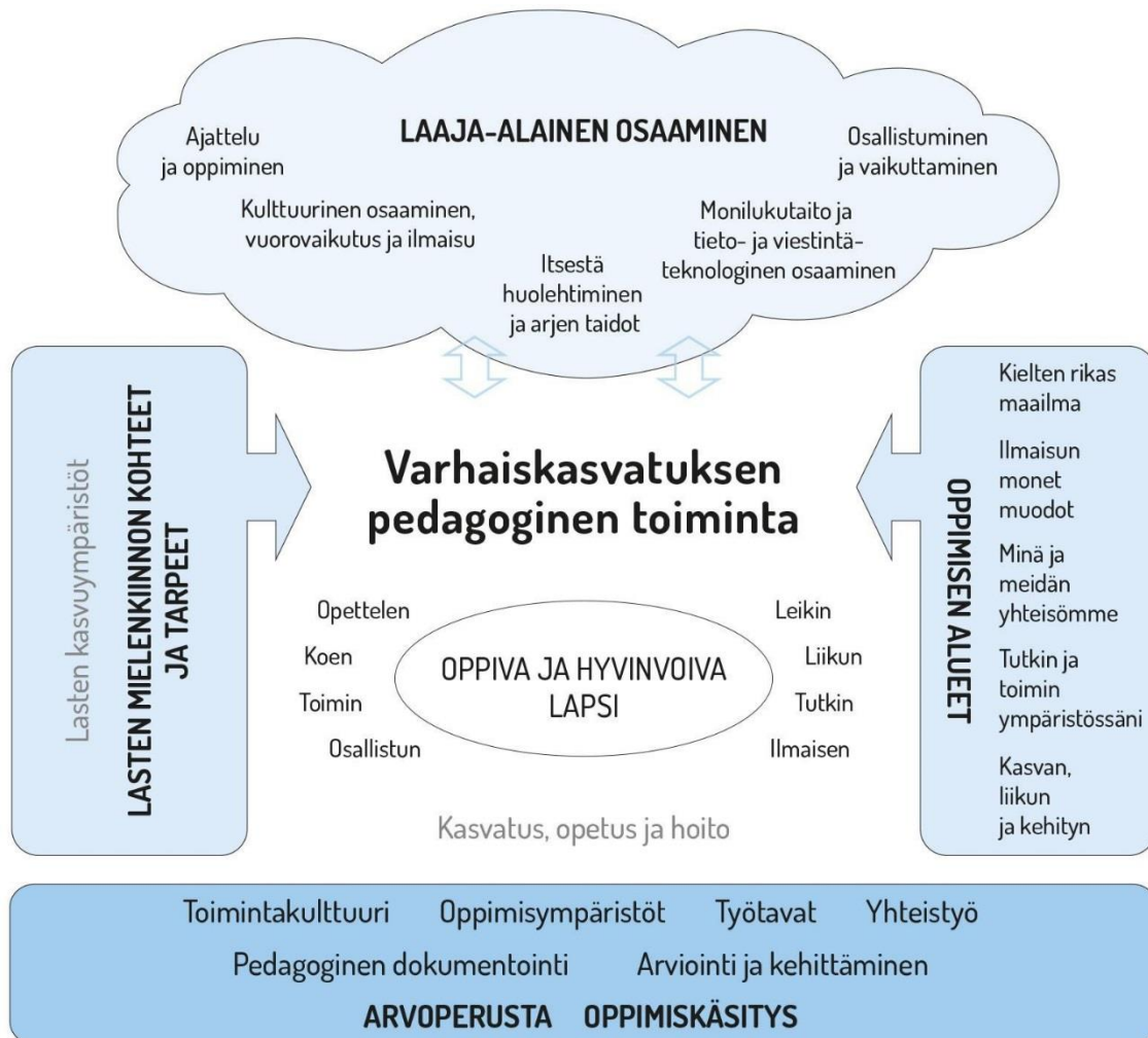
Kuvio 1. Varhaiskasvatuksen pedagogisen toiminnan viitekehys

Varhaiskasvatuksen pedagogista toimintaa ja sen toteuttamista kuvaa kokonaisvaltaisuus. Tavoitteena on edistää lasten oppimista ja hyvinvointia sekä laaja-alaista osaamista (kuvio 1). Pedagoginen toiminta toteutuu lasten ja henkilöstön välisessä vuorovaikutuksessa ja yhteisessä toiminnassa. Lasten omaehtoinen, henkilöstön ja lasten yhdessä ideoima sekä henkilöstön johdolla suunniteltu toiminta täydentävät toisiaan. Varhaiskasvatuksen pedagoginen toiminta läpäisee kasvatuksen, opetuksen ja hoidon kokonaisuuden.