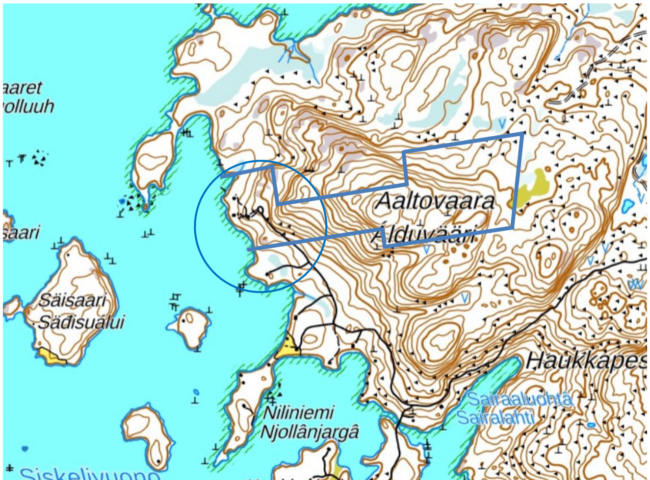
Kuva 1. Lähestymiskartta ja suunnittelualan raja (sininen paksumpi ääriviiva).

Osallistumis- ja arviointisuunnitelma 29.1.2021