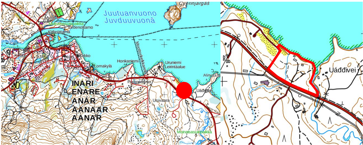
Kuva 1 Kaavoitusalueen sijainti.

Suunnittelualue sijaitsee Inarin kirkonkylän keskustan tuntumassa, noin kolmen kilometrin päässä.