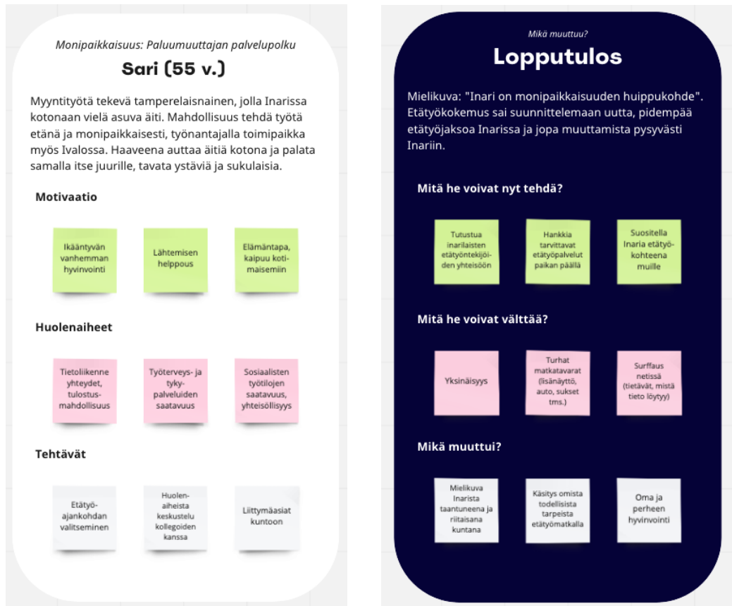
Kuva 2: Monipaikkaisen työn tekijän keskeiset tarpeet kuvattiin keskusteluiden pohjaksi Miro-alustalle.

Monipaikkaista työtä tekevät eivät yleensä näy majoitusta tarjoavien matkailuyritysten asiakkaina, sillä he sijoittuvat asumaan vuokra-asuntoihin tai lapsuudenkotiinsa. He käyttävät kuitenkin monipuolisesti sekä kunnan että alueen yritysten palveluita, ohjelmapalvelut mukaan lukien.