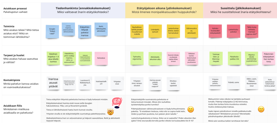
Kuva 3. Etätyöarkea elävän lapsiperheen nykyinen palvelupolku kuvattiin hankkeessa Miro-alustalle keskusteluiden alustamista varten.

Etätyöarkea elävän lapsiperheen nykyinen palvelupolku muodostaa kokonaisuuden, jossa asiakas jää usein kysymystensä kanssa yksin. Tietoa etätyöhön liittyvistä palveluista Inarissa ei löydy kattavasti mistään, eikä alueen yritysten sivuilla pääsääntöisesti ole etätyöntekijöille suunnattuja pakettitarjouksia tai mainintaa puitteista tehdä etätyötä "Suomen kauneimmassa maisemakonttorissa". Reitit, nähtävyydet, aktiviteetit sekä majoitus- ja matkapalvelut sen sijaan löytyvät helposti ja niiden kautta asiakas yleensä päätyykin Inariin, ensisijaisesti matkailijana. Kertomuksia etätyökokemuksista hakukoneet löytävät paremmin muualta Lapista, yleensä Ylläkseltä, Leviltä ja Rovaniemeltä. Tietoliikenneyhteydet herättävät ennakkoon huolta.