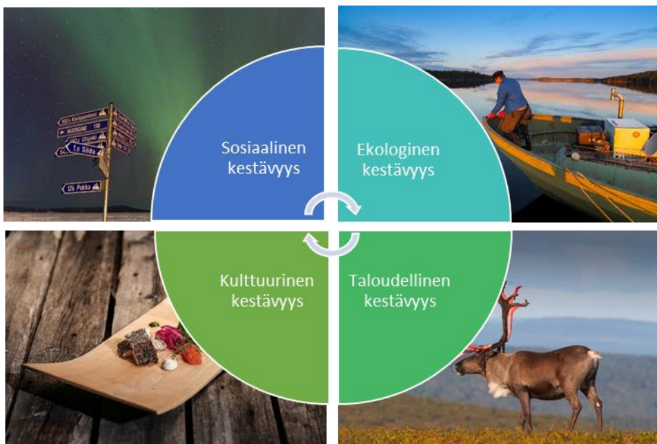
Kuva 1: Kestävän kehityksen osa-alueet

Inarijärvi on Suomen kolmanneksi suurin järvi ja se on monella tapaa arvokas ”helmi” ja aarre. Lähes kaikki merkittävät vedet Inarin kunnassa laskevat vetensä Inarijärveen, ja siten järven säilymiseksi puhtaana halutaan tehdä kaikki mahdollinen. Inarijärvi on vetovoimainen niin elinkeinollisesti, paikallisten ihmisten virkistyskohteena kuin luonnontuotteiden aarreaittana. Hankkeen toimenpiteet kohdentuvat pääasiassa Inarijärven ympärillä oleviin kyliin ja kylien toimijoihin. Hankekyliä ovat pääasiassa Inari, Nellim, Veskonieni, Keväjäjärvi ja Partakko. Myös muiden kylien toimijat voivat olla hankkeessa mukana. Hankkeessa Inarijärveä tullaan käsittelemään monipuolisena kestävän matkailun toiminta-alueena, ei vain järvenä.