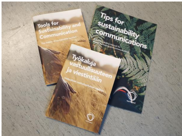
Kuva 3: Visit Finlandin vastuullisen matkailun työkirjat.

Visit Finland tekee työtä kestävän matkailun eteen. Viimeisimpinä työkaluina yrityksiin saatiin suomen- ja englanninkieliset käsikirjat kestävän matkailun toimenpiteiden toteuttamiseksi. Visit Finland ja Inari-Saariselkä Matkailu ovat pitäneet infotilaisuuksia valtakunnallisesta kestävän matkailun strategiasta ja jakaneet työkirjoja alueen yrityksille.