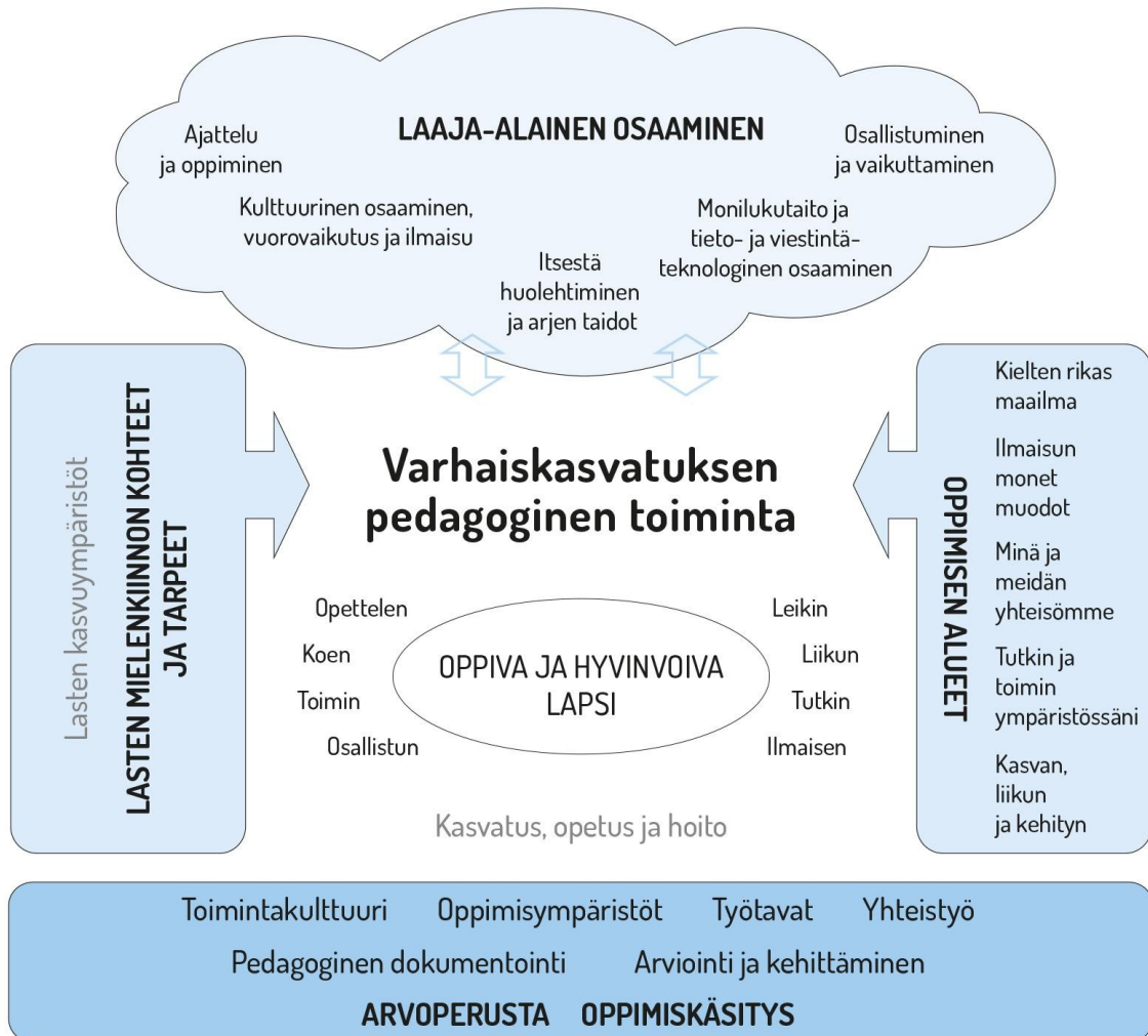
Kuvio 1. Varhaiskasvatuksen pedagogisen toiminnan viitekehys

Varhaiskasvatuksen pedagogista toimintaa ja sen toteuttamista kuvaa kokonaisvaltaisuus. Tavoitteena on edistää lasten oppimista ja hyvinvointia sekä laaja-alaista osaamista (kuvio 1). Pedagoginen toiminta toteutuu lasten ja henkilöstön välisessä vuorovaikutuksessa ja yhteisessä toiminnassa. Lasten omaehtoinen, henkilöstön ja lasten yhdessä ideoima sekä henkilöstön johdolla suunniteltu toiminta täydentävät toisiaan. Varhaiskasvatuksen pedagoginen toiminta läpäisee kasvatuksen, opetuksen ja hoidon kokonaisuuden.