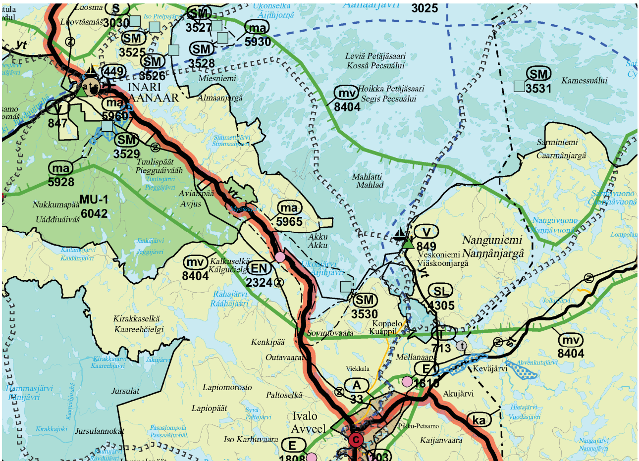
Kuva 3 Ote maakuntakaavasta.