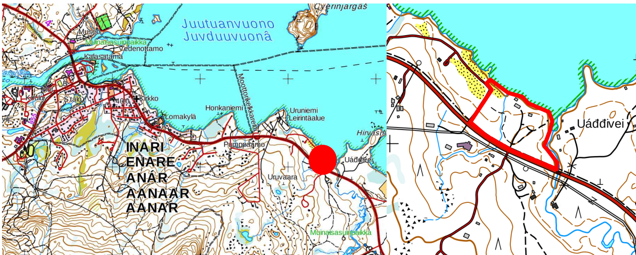
Kuva 1 Kaavoitusalueen sijainti.

Suunnittelualue sijaitsee Inarin kirkonkylän keskustan tuntumassa, noin kolmen kilometrin päässä.